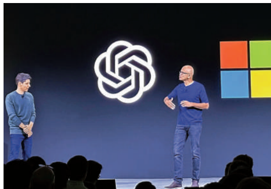
OpenAI行政總裁阿爾特曼（左）和微軟CEO納德拉在6日的開發者大會上講話。

用戶遇到ChatGPT無法登入等問題時，可以嘗試更換瀏覽器打開網頁、檢查網絡連接，或暫時使用其他AI聊天機器人。