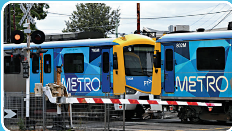
Optus故障導致墨爾本火車服務大面積中斷。