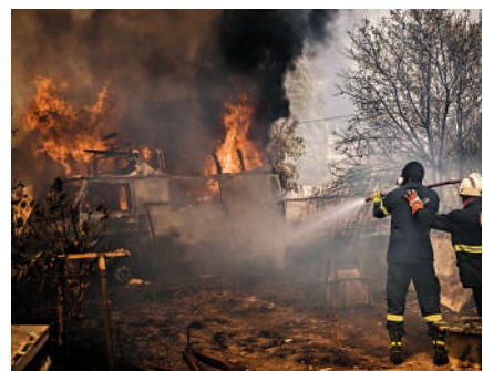
今年夏天異常炎熱，圖為希臘消防員8月在雅典北部滅火。

與此同時，今年極端天氣愈發頻繁來襲：已經造成數千人死亡的利比亞洪災、南美洲的嚴重熱浪與加拿大有史以來最嚴重的山火等。