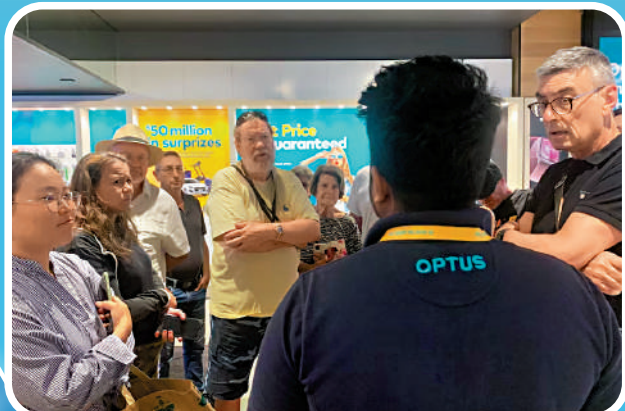
Optus發生故障後，用戶聚集在門店內諮詢。