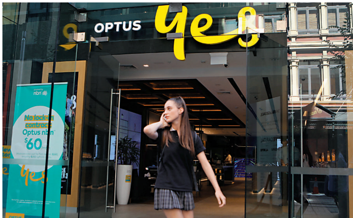
一名女子經過悉尼一間Optus門店前。

此外，澳洲多間醫院受到斷網影響。墨爾本的一名護理人員稱，當天早上Optus服務中斷期間，一名病人突然心臟驟停，但卻無法呼叫救護車。一名婦女稱，她和入住悉尼附近一間醫院的母親一度失聯。布里斯班的北都會醫院和衛生服務中心也表示，斷網令病患和工作人員難以與該醫院取得聯繫。