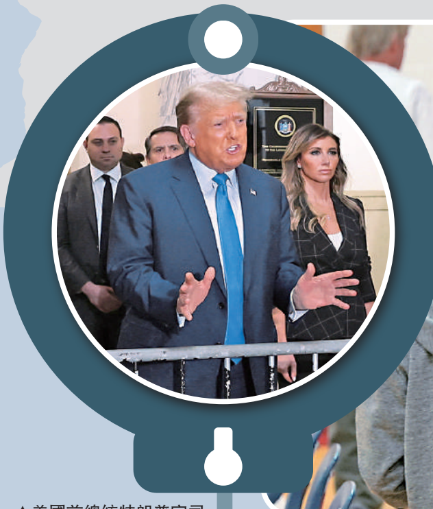
▲美國前總統特朗普官司纏身。圖為他6日在為民事欺詐案出庭。