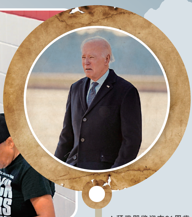
▲拜登即將迎來81周年生日。