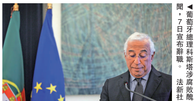
▲葡萄牙總理科斯塔涉貪腐辭職。