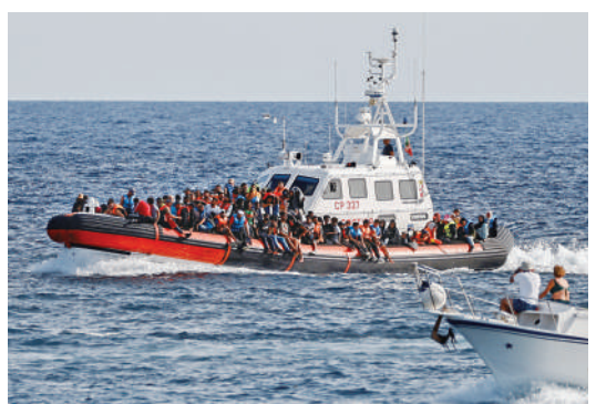
▲一艘意大利海岸警衛隊船隻9月18日在意大利西西里島附近載着一批移民。