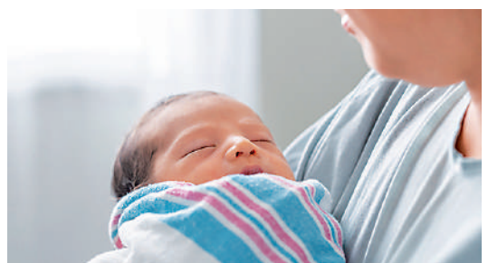
▲美國去年有超過3700例新生兒患梅毒病例。圖為一位母親抱著一名新生兒。網絡圖片

【大公報訊】據CNN報道：美國疾病控制和預防中心(CDC)7日發布的最新數據顯示，過去10年美國新生兒梅毒病例暴增10倍，去年