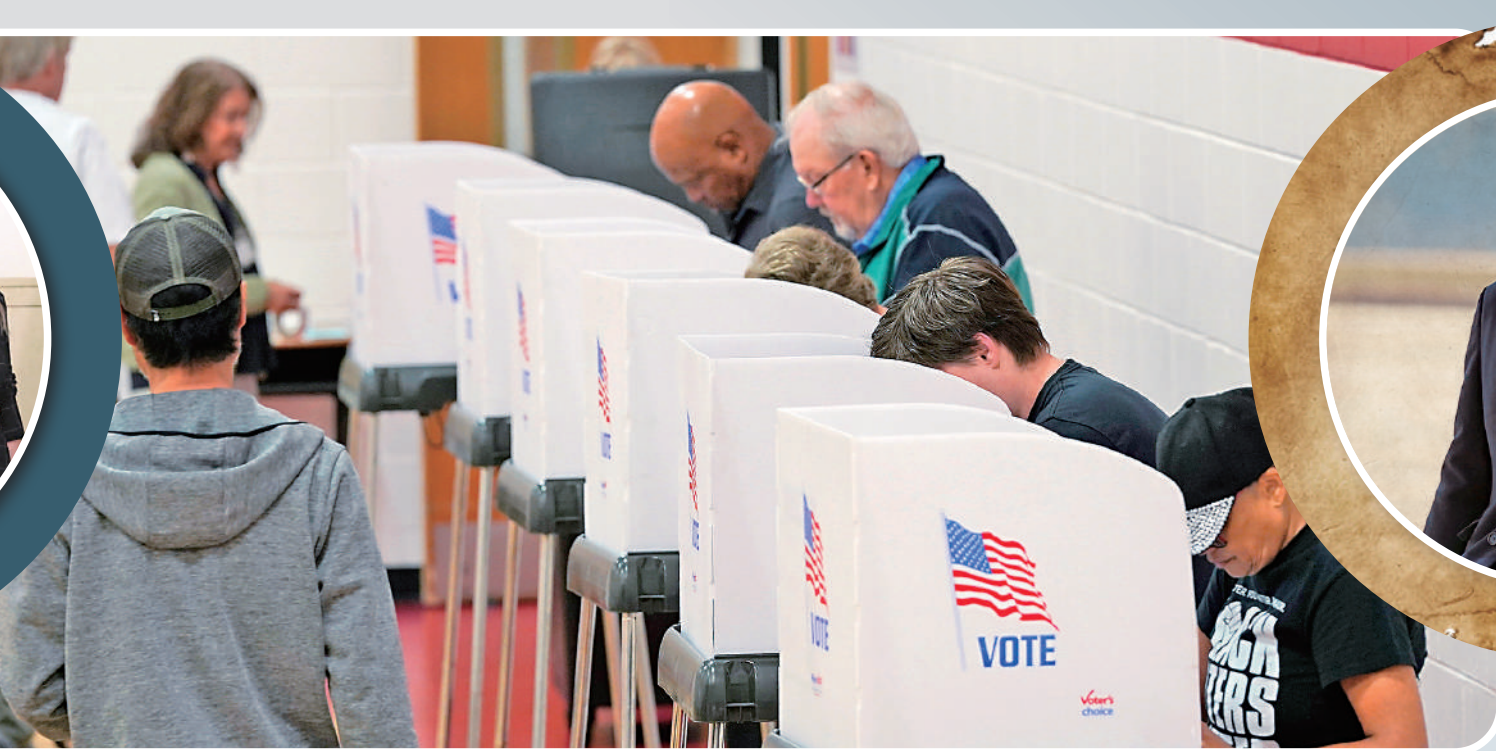
▲美國多州7日舉行地方選舉投票。圖為弗吉尼亞州選民7日在投票站投票。