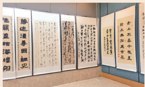
▲「這邊風景2023——深圳南山、珠海香洲、香港、澳門地區書法交流展」展廳現場。

聯展已連續舉辦五屆，四地書法家通過這個交流平台，互賞互鑒，為推動四地書法發展而作出貢獻，呈現灣區書法風情。今次展覽首站來到香港，接下來還將移師至深圳、珠海、澳門進行聯展。