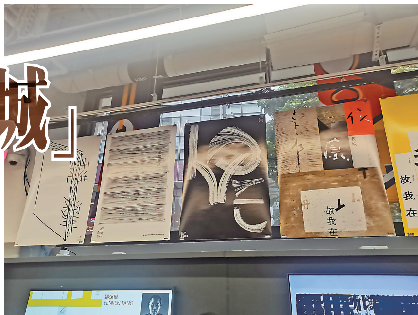
▲靳埭強設計海報是繁體字和簡體字「讀」的重疊。