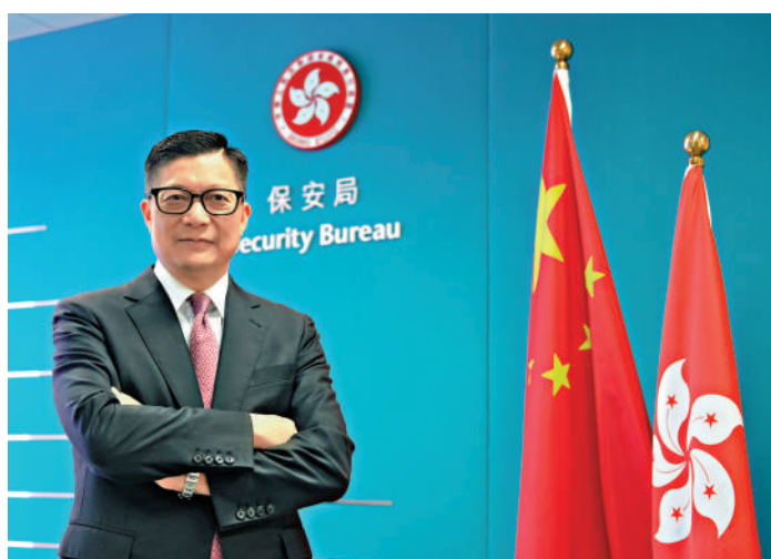
▲保安局局長鄧炳強接受《大公報》訪問表示，經歷2019年的黑暴，相信市民清楚看到23條有立法的必要。