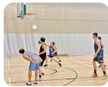
▲市民預訂康體場地，須改用SmartPLAY。