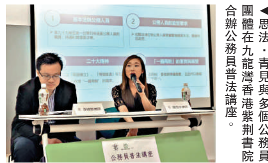
▲思法、青見與多個公務員團體在九龍灣香港紫荊書院合辦公務員普法講座。

李健豪呼籲所有香港人全面準確把握憲法與基本法的關係，尊重、共同守護香港的憲制秩序，讓「一國兩制」重要原則在香港繼續行穩致遠。