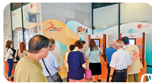
▲有市民因登記SmartPLAY遇上困難，往體育館求助。