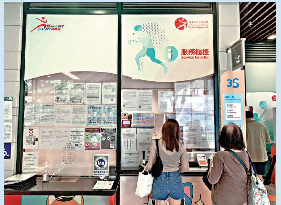
▶SmartPLAY昨日啟用即大塞車，有市民改為親身往體育館訂場。

SmartPLAY系統是為進一步打擊「炒場」活動而設，取代原有的「康體通」，新功能包括需實名登記及承諾不會轉讓場地。該系統可容許一萬人同時登入預訂，查閱各項康體設施的預約情況，亦能查詢已經取消的預約段節再預約，新系統同時提供「先到先得」方式，接受康體活動報名。昨日上午7時，系統正式啟用。