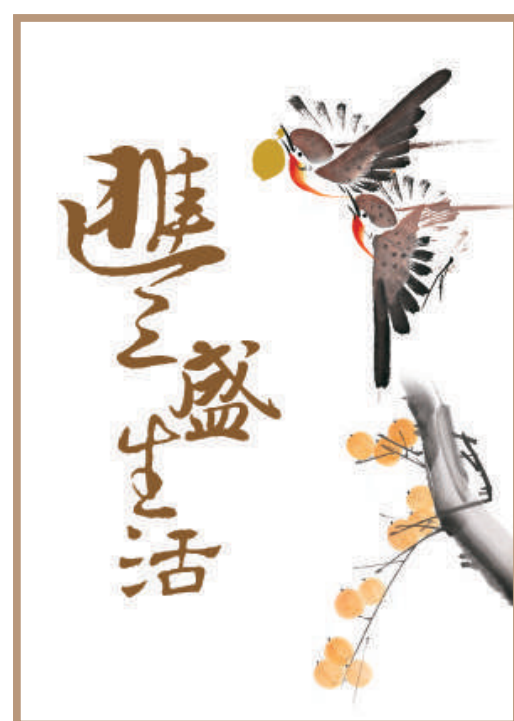
「一對叢林鳥均呈昂首向上姿態,寓意「通達理財服務」將與客戶並肩同行,展開豐裕生活的美麗畫卷。」

隨着兩地居民跨境投資的需求日益增長,交通銀行(香港)與交通銀行廣東省及深圳分行合作,於2021年成為首批推出「跨境理財通」服務的試點銀行,協助兩地合資格居民便捷地進行跨境資產配置。此外,為滿足港澳居民於內地城市置業的資金調配需要,交通銀行(香港)提供「房達通」內地物業貸款服務,為客戶提供跨境貸款服務,靈活配合尊貴客戶跨境理財及資產配置需要。客戶可憑「通達理財服務」雙幣卡於港澳及