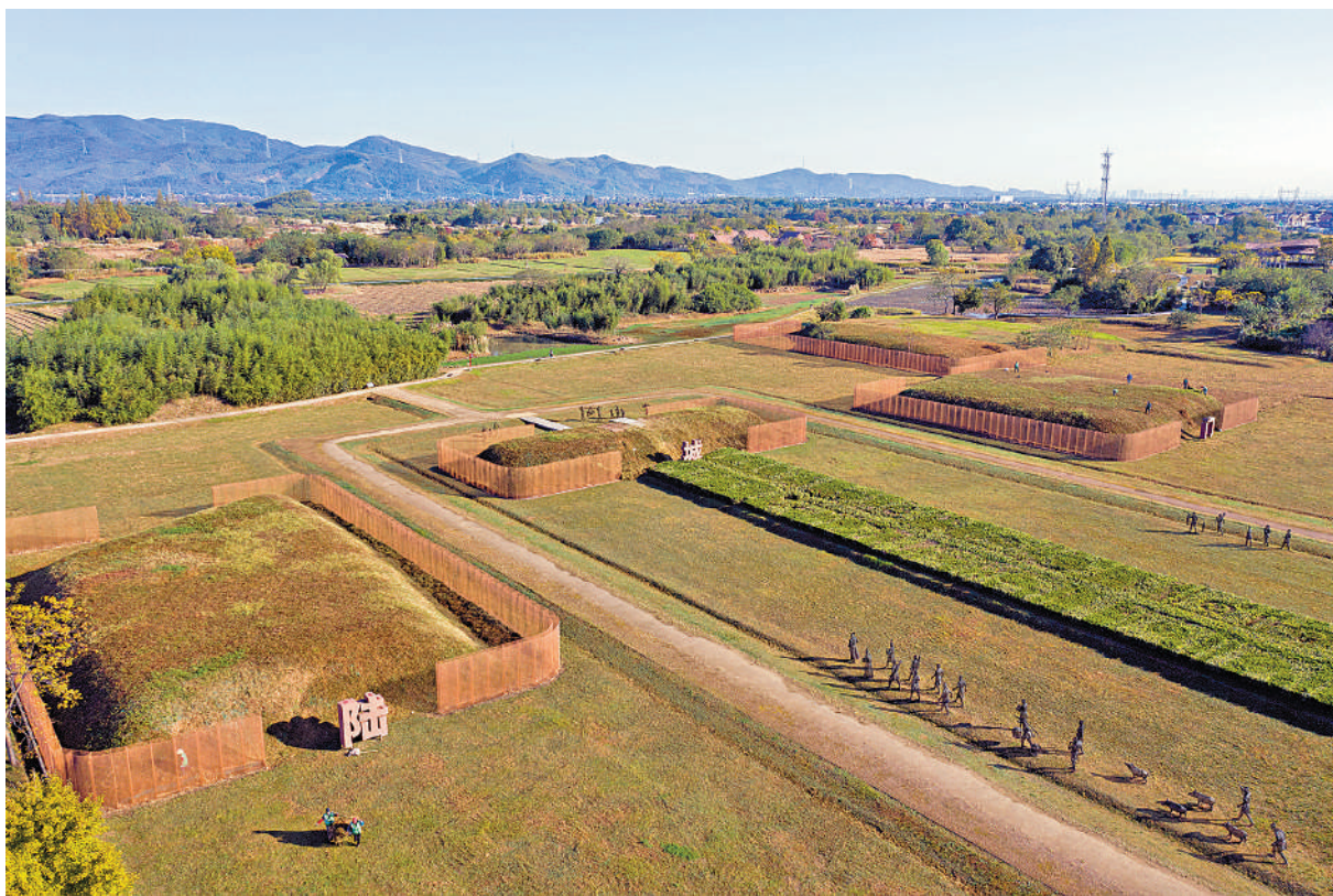
▲良渚古城遺址公園中的陸城門遺址。