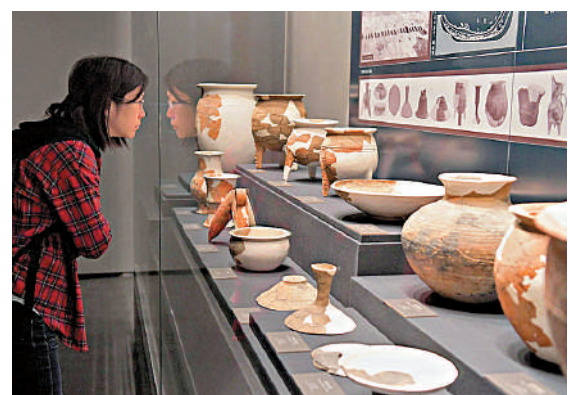
▲二里頭夏都遺址博物館展出的陶器。學界認爲，二里頭文化與古文獻記載的夏王朝，在地域和文化上非常接近。

眾所周知，中國有漫長的農業時代，我們喜歡說一句話：往上數三代，誰家都是農民。隨着城市化的推進，對於「90後」「00後」來說，上數「三代」可能不夠了，但農業對於中國文明的意義怎麼強調也不爲過。如作者所言，「要理解當代中國，理解中國文化的特性，就必須了解中國農業時代的開端以及中國文明的形成過程。這是一段輝煌