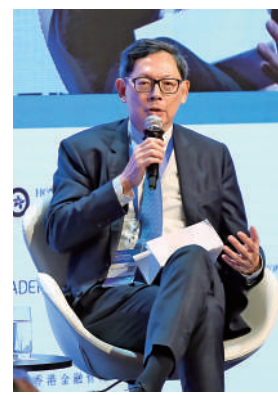
金管局前總裁陳德霖退任後創辦圓幣科技集團，旗下圓幣錢包經過6星期的測試後，今日正式啟業。

此外，集團旗下儲值支付工具圓幣錢包宣布，將於今日全面啟業，為香港、海外和離岸企業提供