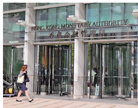
金融學院「金融領袖計劃」獲得政府部門與各個金融監管機構全力支持。

在啟發金融優秀人才，培養他們的領袖思維並加強他們從宏觀視角思考問題的能力，以及拓闊他們的人際網絡。該計劃為參與者提供與金融和其他界別的頂尖領袖對談的獨特機會，金融學院會員事務委員會將對申請進行甄選，計劃獲得政府部門與各個金融監管機構全力支持。