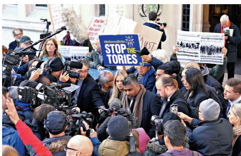
▲代表非法移民的律師和反對「盧旺達計劃」的示威者15日聚集在英國最高法院門外。

今年已有超過2.7萬名非法移民抵達英國南部海岸，約17.5萬尋求庇護者正在英國等待當局處理他們的申請，英國政府每天都要花費800萬英鎊為他們提供住宿。英國在野黨、聯合國難民署等批評「盧旺達計劃」並不能從根本上解決問題，且「不人道」。