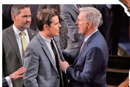
▲今年1月6日，麥卡錫(右一)與共和黨籍眾議員蓋茨(右二)發生爭執。

近期美國國會因兩黨無法就長期預算案達成一致、眾議院議長下台等事件陷入分裂和動盪。新上任的眾議院議長約翰遜14日坦言，如今的眾議院就像