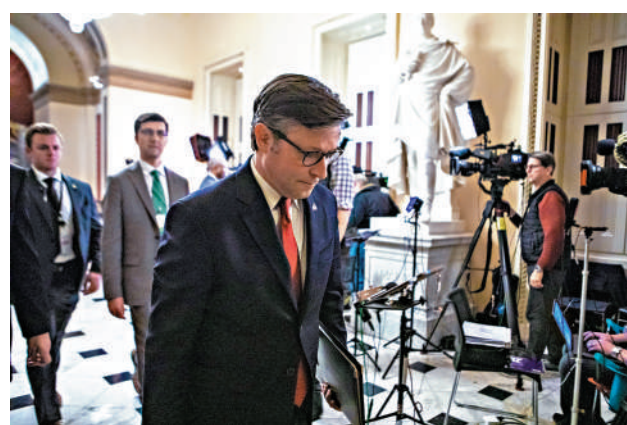
▲美國眾議院議長約翰遜提出的臨時預算案14日在眾議院通過。