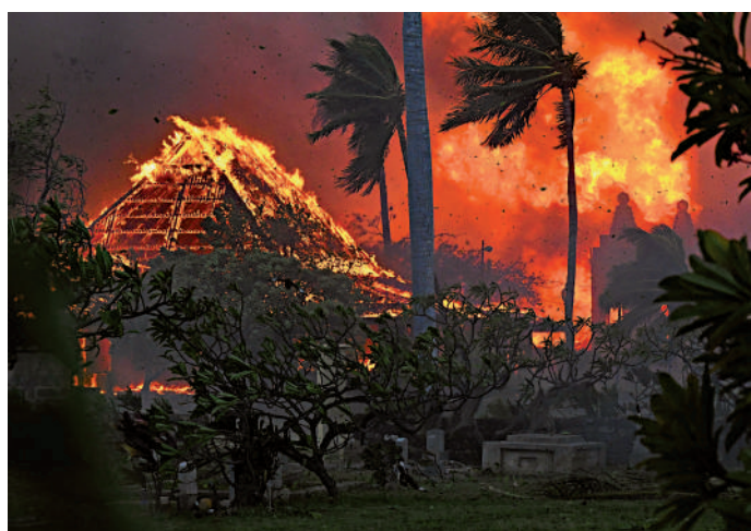
▲夏威夷毛伊島8月遭遇山火，經濟損失慘重。

美國今年已遭遇多次極端天氣。8月底，超強颶風「伊達利亞」登陸佛州，導致數十萬用戶斷電。8月上旬，旅遊勝地夏威夷毛伊島遭遇山火，大片民宅和商舖被燒毀，當地旅遊業亦受到重挫，經濟損失估計高達60億美元。7月，美國東北部賓夕法尼亞州、佛蒙特州、紐約州等地降下暴雨，多地遭遇洪災，佛蒙特州超過4000間住宅和800間商舖受損。