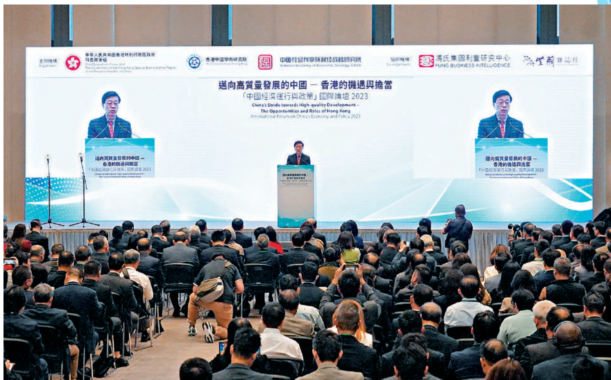
▲「中國經濟運行與政策」國際論壇昨日在特區政府總部舉行，行政長官李家超作開幕演講。

行政長官李家超表示，政府將積極發掘新增長點，推動創新科技等新興產業，維持香港競爭力，促進經濟多元發展。中央政府駐港聯絡辦主任鄭雁雄致辭，他對香港提出「堅持創新發展」、「堅持協調發展」等「五個堅持」，指出及時完成23條本地立法，將為香港營造更安全的發展環境。香港要在變局中開創新局，很大程度取決於勇於識變應變求變，取決於自身發展理念的更新，取決於能否以高質量發展駕馭世界變數、實現香港著數、推動由治及興。