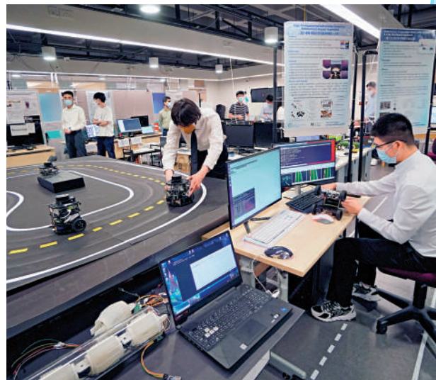
▲特區政府將積極發掘新增長點，推動創新科技等新興產業，維持香港競爭力。

鄭雁雄強調，安全是發展的根基，穩定是發展的前提，高質量發展離不開高水平安全保障。統籌好發展和安全，落實好特區憲制責任，依法嚴懲危害國家安全犯罪活動，圓滿完成第七屆區議會換屆選舉，及時完成基本法第23條本地立法，將為香港營造更加持久安全的發展環境，也將為世界各地的創業者投資者來港施展抱負創造更加穩定的營商環境。中央政府駐港聯絡辦將繼續當好「超級牽線人、超級勤務員」，全力支持行政長官和特區政府依法施政，全力支持香港在高質量發展道路上不斷開創新局面、實現新飛躍，為強國建設、民族復興偉業不斷增光添彩。