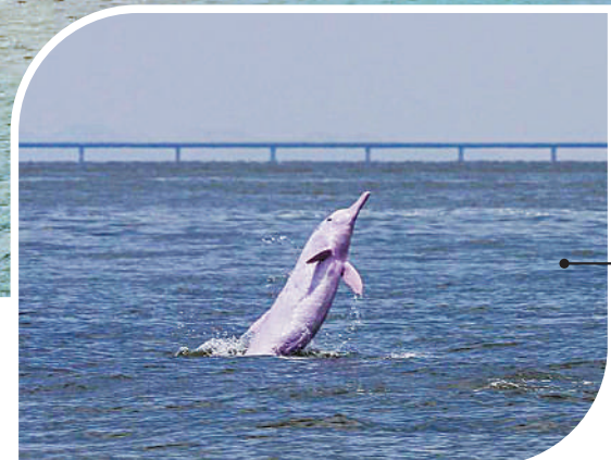
▲中華白海豚躍出水面與港珠澳大橋同框。