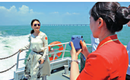
▲內地旅行社開發旅遊線路，遊客可乘船看大橋風光。