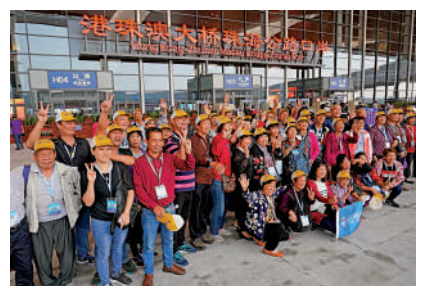
▲旅遊團在港珠澳大橋珠海公路口岸門前合影留念。

港珠澳大橋管理局副局長段國欽介紹，遊客可有三大體驗：一是領略國家工程的風采，厚植愛國主義情懷。打卡港珠澳大橋這個全國愛國主義教育示範基地，進一步堅定對中國特色社會主義的道路自信、理論自信、制度自信、文化自信。二是感受橋樑科普文化，聆聽大橋故事。了解大橋建設中體現的我國綜合國力、自主創新能力，感受建設者勇創世界一流的民族志氣。三是打卡超級工程，共享改革開放成果。遊客可近距離遊覽「風帆」造型的九洲橋、「海豚」造型的江海橋、「中國結」造型的青