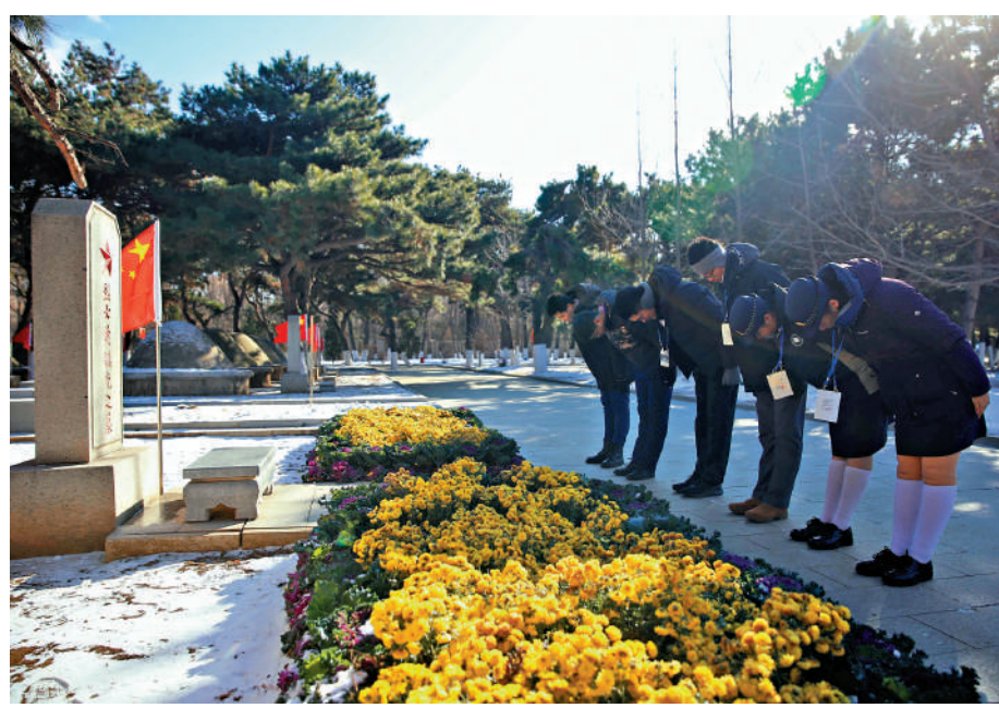
▲來自香港的師生在瀋陽抗美援朝烈士陵園內的烈士墓前鞠躬致敬。

之際，一批志願軍將士在戰爭期間寫給所在單位、機構的書信首次在瀋陽公開。書信字裏行間浸透着濃濃的家國之情。參與此次「英雄精神·城市豐碑——紀念抗美援朝勝利70周年（瀋陽）歷史圖片展」策劃的專家、中國近現代史史科學會名譽會長王建學介紹，此次展出的書信手稿多數是在前線的志願軍戰士寫給家人、單位的回信，主要展現了前線戰士與後方人民的相互鼓舞。「當年，瀋陽市各級單位和學校都給前線戰士寫信，這也成為前線慰問的重要組成部分。」王建學介紹。他同時還透露，目前還有一批珍貴的志願軍烈士家書正在整理中，未來有望集結成冊，對外公開。