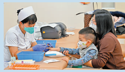
▲在吉林大學第二醫院兒科診室，護士為患兒採血。