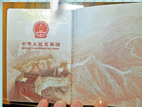
▼►中國護照首頁的萬里長城圖案取自八達嶺段長城。