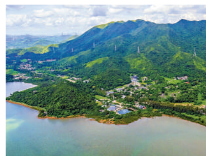
▲紅花嶺將成為香港第25個郊野公園。

涵蓋紅花嶺郊野公園已予批准地圖的指定令將於本月29日提交立法會進行先訂立後審議的程序，生效日期預計為明年3月1日。