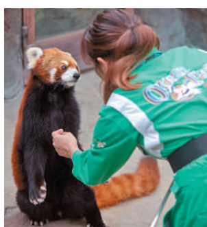
▲四川當局延長海洋公園現有有三隻小熊貓的借用時期，並會再借出多批小熊貓。