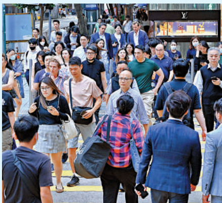
▲引進辦吸引約30家重點企業夥伴落戶香港，未來幾年將在港投資超過300億元，創造約10000個就業機會。

數據顯示，目前已有超過3400家科創企業進駐香港。數碼港匯聚超過2000間初創企業和科技公司，包括六家「獨角獸企業」，分別有GOGOX、