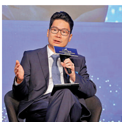
▲陳浩濂表示，香港全力深化與內地金融市場互聯互通。

陳浩濂指出，特區政府會聯同監管機構繼續全力深化兩地金融市場互聯互通，推動實施將人民幣櫃台納入港股通，促進香港股票人民幣計價交易，同時繼續推動落實離岸國債期貨的措施，並增加人民幣投資產品種類，強化香港離岸人民幣中心地位，助力人民幣國際化進程。當局亦會繼續與內地商討互聯互通各項擴容增量方案和優化安排，包括進一步優化債券通以及增加滬深港通的產品類別和交易機制，為香港資本市場持續注入新動力。