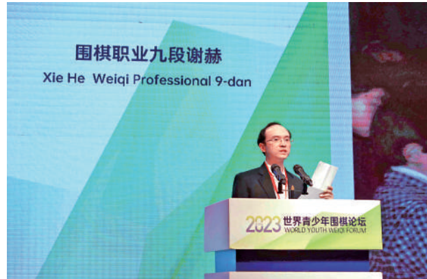
▲圍棋職業九段謝赫發言。

能看到他有明顯的進步。」Bende的故事引發了謝赫個人的思考，「互聯網的優勢是，即使遠隔萬里，也能進行對局和研討。那麼，我們能否利用互聯網將暫時不能選擇留學的、世界各地的青少年棋手們聚集起來，他們可以在網上，就像面對面一樣，進行高質量的訓練對局，並定期舉行研討會。以此進一步改善他們的學棋條件。」謝赫說。