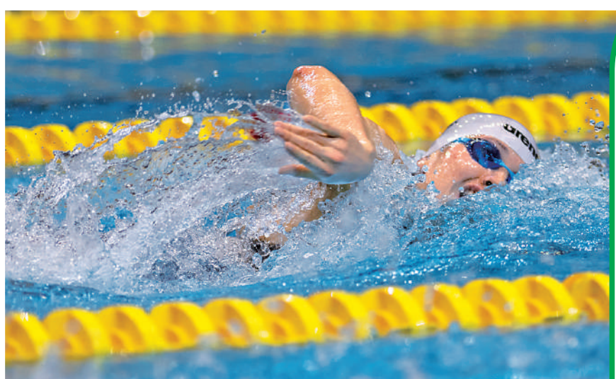
▲何詩蓓在美國公開賽400米自先奪得一枚銅牌。

【大公報訊】中國香港「女飛魚」何詩蓓自10月底出戰3站世界盃之後，小休一個月，日前回歸賽池參加美國公開游泳錦標賽。香港時間周五(1日)舉行次天賽事，何詩蓓一日雙賽下先在女子400米自由泳獲得銅牌，再於50米自由泳取得第5。