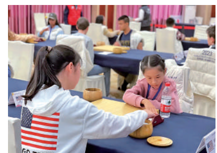
▲衢州國際兒童友好業餘圍棋邀請賽比賽現場。

【大公報訊】記者連啟鈺報道：「世界各國、各地區應把推動青少年圍棋發展放在重要位置，進一步聚焦、推動、行動，努力為青少年提供更多接觸圍棋、獲得優質教學以及參加比賽和培訓的機會。」1日，在浙江