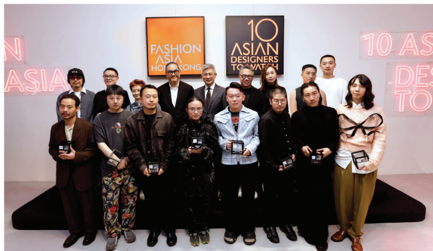
本屆「亞洲十大焦點設計師」獲獎設計師與主禮嘉賓合照。

本地時裝盛事 FASHION ASIA HONG KONG 2023 (Fashion Asia) 於11月底盛大舉行，當中兩大旗艦活動「亞洲十大焦點設計師」時裝展覽及「時尚未來論壇」在主辦單位香港設計中心的精心策劃及主要贊助單位香港特別行政區政府「創意香港」的鼎力支持下順利舉行。