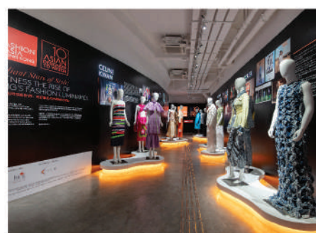
「亞洲十大焦點設計師」時裝展覽早前於西九文化區藝術展亭舉行。