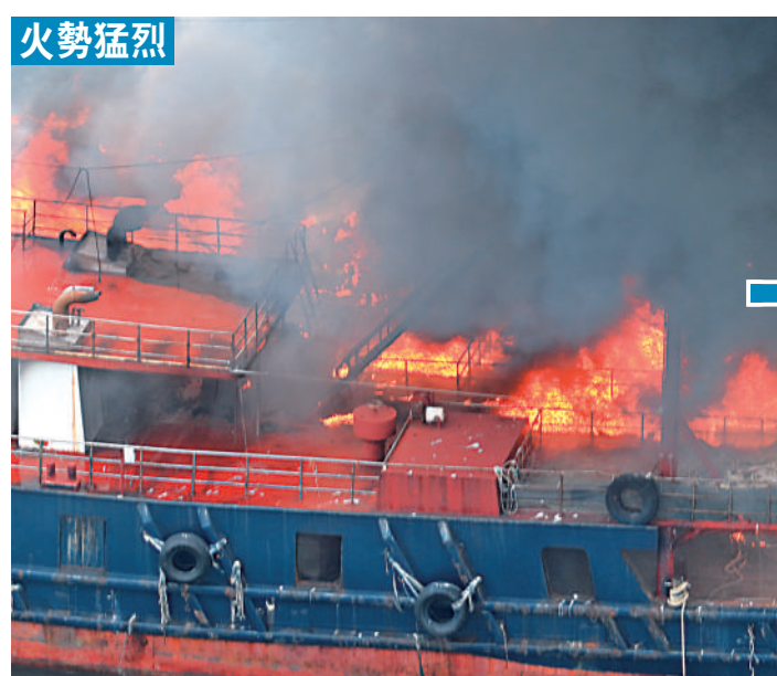
▲約下午3時50分，香港仔南避風塘一艘漁船突然起火焚燒，濃煙席捲半空。

【大公報訊】香港仔避風塘昨日下午有漁船起火，大公報記者拍攝到的現場影片可見，涉事船隻火光熊熊，大量黑煙衝上半空。