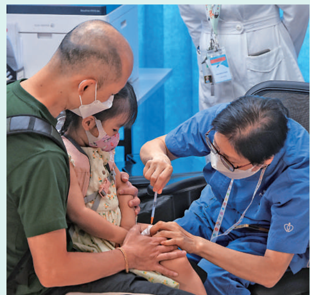
▲兒童新冠及流感嚴重個案持續出現，醫衛局呼籲盡快接種流感或新冠疫苗加強劑。