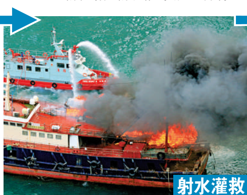
▲消防船到場派出兩條喉及一隊煙帽隊救火。

【大公報訊】香港仔避風塘昨日下午有漁船起火，大公報記者拍攝到的現場影片可見，涉事船隻火光熊熊，大量黑煙衝上半空。