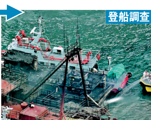
▲消防仍不斷射水降溫防止死灰復燃，並登船調查起火原因。