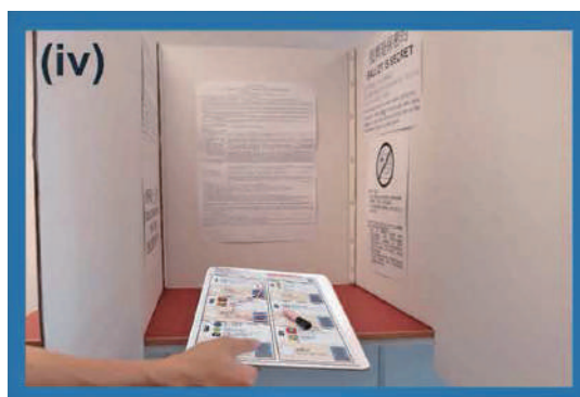
(iv) 選民進入投票間，用投票站提供的印章，親自在投票間於選票所選擇的候選人相對的圓圈內蓋上一個「剔」號（請注意：每名選民只能在選票上就所選擇的一個候選人蓋上「剔」號，否則選票將會作廢）