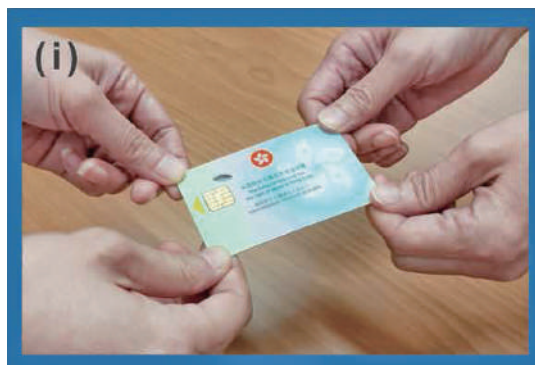
(i) 選民須出示香港身份證正本