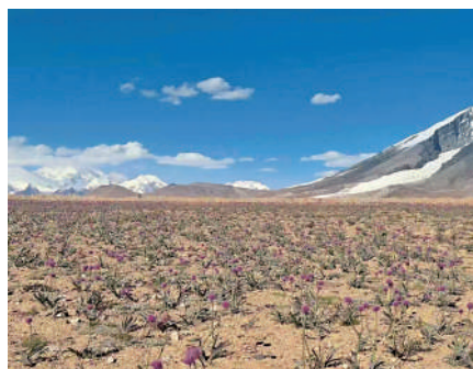
▲葱嶺上開着花的野蔥。