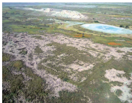
▲馬迷途盆地蘆葦叢中的漢代玉門關——塼障遺跡。