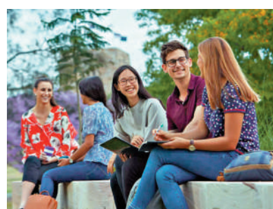
▲澳洲政府將提高對外國學生的語言要求。圖為學生在校園內交流。

報道指，澳洲是目前世界上勞動力資源最為緊張的國家之一，幾乎所有政策問題都因勞動力短缺而加劇，無論是能源轉型、教育還是護理經濟。工黨政府長期依賴移民供應人力資源，致力加快高技術工人的入境速度，並為他們獲得永久