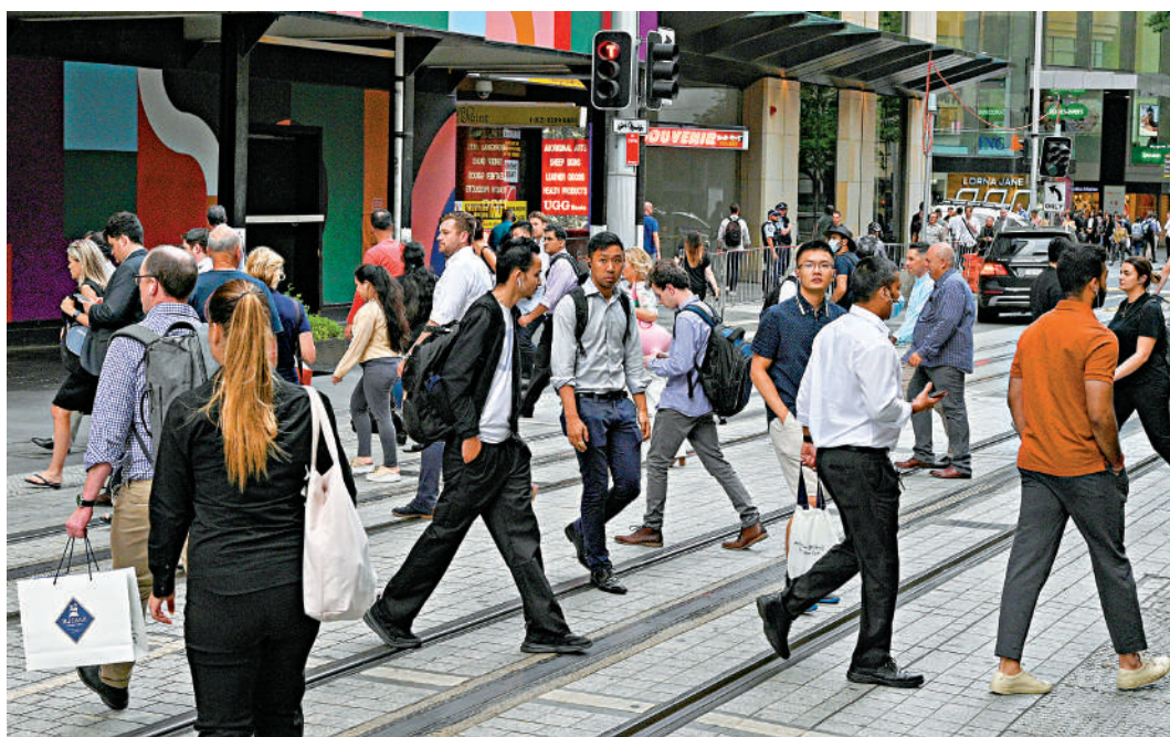
◀2020年12月，澳洲悉尼街頭行人匆匆。

【大公報訊】綜合BBC、路透社、彭博社報道：當地時間11日，澳洲政府發表新移民政策，收緊針對留學生和部分低技術工的簽證要求，如國際學生需要更高的英語測試成績等。當局希望未來兩年內移民人數減少一半，徹底改革目前崩潰的移民制度。