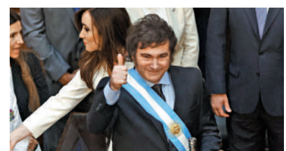
▲阿根廷新總統米萊10日在首都布宜諾斯艾利斯宣誓就職。

參與米萊10日就職典禮的多國政要中，烏克蘭總統澤連斯基和匈牙利總理歐爾班進行了盡可能坦誠的交談，雙方討論了歐洲事務。