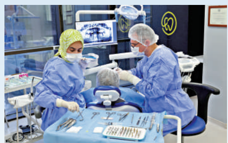
▲一位英國婦女在土耳其一家牙科診所植牙。

傳的刻板印象，實際上，英國牙醫短缺的問題也很嚴重。2021年，經濟合作暨發展組織（OECD）最富有的22個國家中，英國牙醫數量是倒數第三。國民保健署（NHS）不合理的撥款機制也讓問