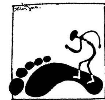
盲從——你付出代價後發覺到達的是別人的目標。