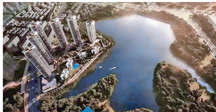
▲天湖島花園緊鄰民治水庫，居住密度低，環境舒適。