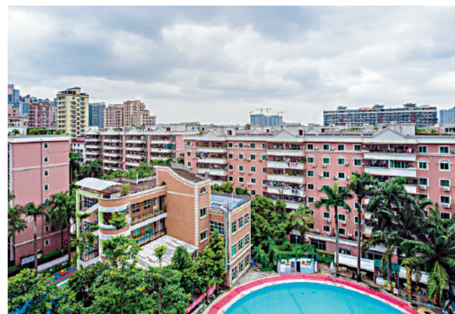
▲溼水山莊外立面以白色和磚紅色為主，樓實簡約。