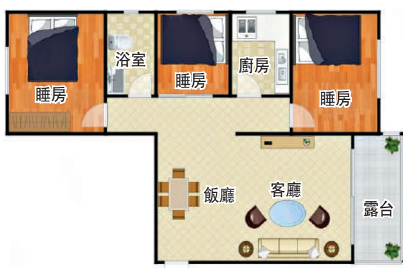
▲溼水山莊77平米三房兩廳戶型圖。

商業消費便利，附近的星河WORLD COCO Park，集購物、餐飲、休閒娛樂等為一體，為居民逛街休閒提供便利。距小區約200多米有萬寧超市，物品齊全，可滿足日常生活需求。醫療方面，100多米外有藥房，3.8公里遠有深圳市第二人民醫院，為深圳知名的甲級醫院。