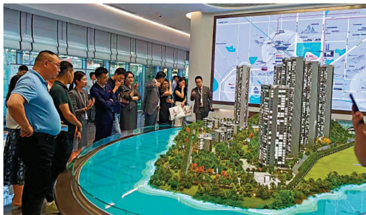
▲天湖島花園為龍華區民治街道新盤，受買家關注。