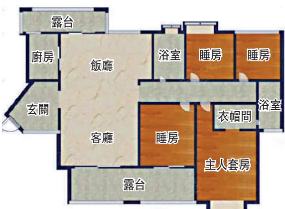
▲鴻榮源·熙園山院154平米四房兩廳戶型圖。

小區有高檔會所，3300平米商場及社區服務中心，並設有幼兒園。項目由金地物業提供物業管理服務，助力業主實現高品質生活。