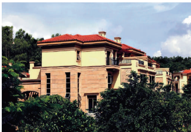
▲鴻榮源·熙園山院提供近七百個單位，建築物依山坡地形而建。