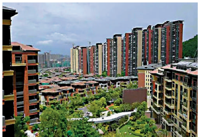
▲星河丹堤戶型多元化，由獨立別墅、聯排別墅及高層單位組成。

商業配套方面，天湖島花園附近有多個商場，包括星河WORLD COCO City、8號倉奧特萊斯、華南首家Costco、山姆會員店等。教育配套方面，項目有24班小學，周邊有溼水山莊幼兒園、溪山幼兒園、星河丹堤實驗學校等。