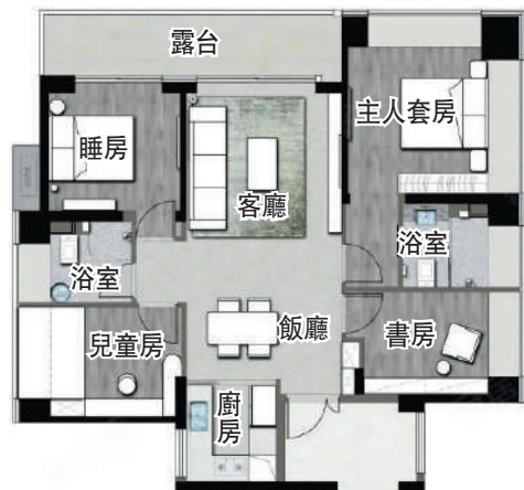
▶天湖島花園124平米四房兩廳戶型圖。