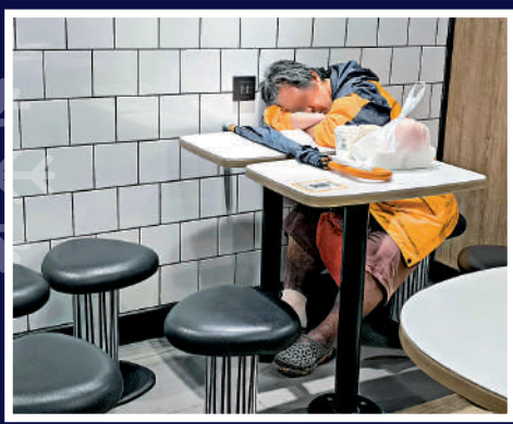
▶氣溫急降，有24小時快餐店讓無家可歸者入內休息，送上溫暖。