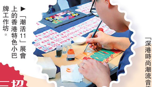
▲「潮活11」展會上的香港特色小巴工作坊。