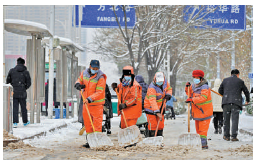
▲自10日以來，河北石家莊迎來多輪降雪。圖為15日，環衛工人在街邊清雪。中新社

16日早晨，強寒潮已抵達江南、華南地區，氣溫驟降，全國共有20個省會級城市最低氣溫創下半年來新低。其中，青海西寧及內蒙古呼和浩特為下半年來首次跌破-20℃，北京、天津、山東濟南為下半年來首次跌破-10℃，貴州貴陽為下半年來首次跌破0℃。15日晚到16日晨，武漢、合肥、南京、上海、貴陽等地均出現了今冬初雪。