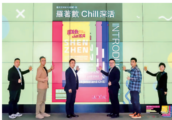
▲啟動儀式上，羅湖潮流消費手冊首次亮相，將免費向深港兩地消費者發放。