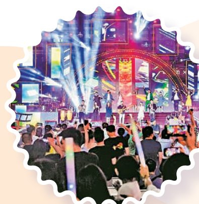
▲今年7月，羅湖舉辦了「深港時尚潮流音樂會」。