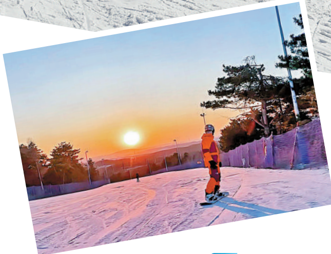
滑雪愛好者在長春天定山滑雪場體驗冰雪魅力。