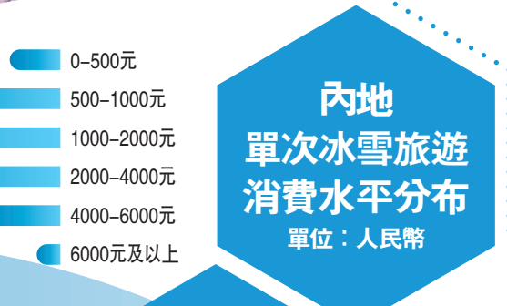
內地單次冰雪旅遊消費水平分布 單位：人民幣