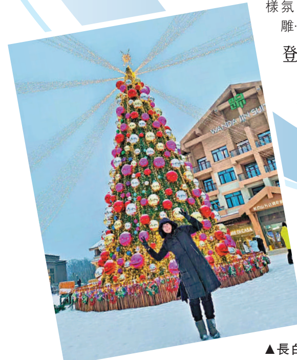
▲長白山萬達國際度假區已點亮聖誕樹，遊客與聖誕樹合影留念。