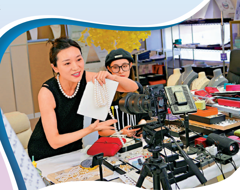
▲浙江諸暨一電商直播基地，一名主播在直播中推介珍珠產品。