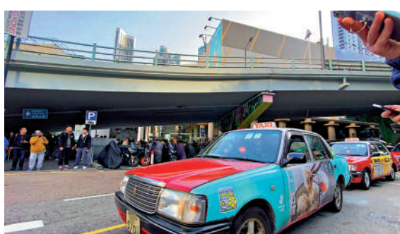
▲《大公報》日前揭發中環鐘士街士不接客收費情況嚴重。