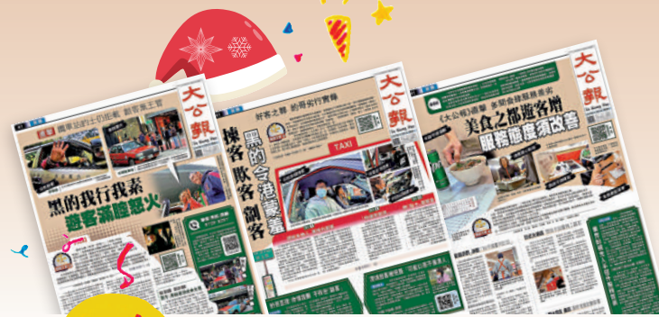
▲《大公報》連日推出專題報道，揭露部分行業待客態度差劣，影響本港聲譽。報道受到社會各界認同。