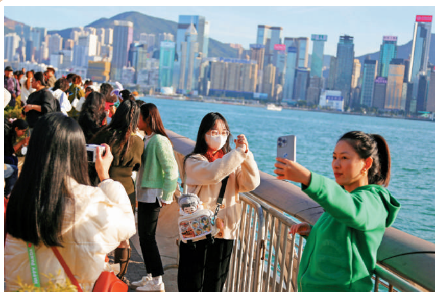
▲昨日有30位議員對《大公報》表示，支持發起「禮貌運動」，讓旅客感受到熱情及好客，增加香港旅遊吸引力。