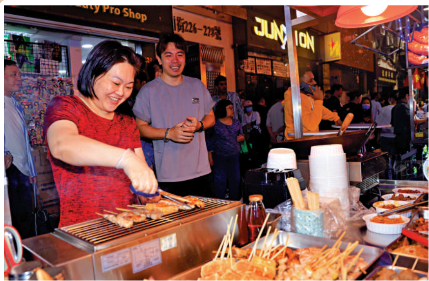
▲立法會議員呼籲，服務業多一些笑容，令旅客有賓至如歸感覺，讓香港重新贏回「好客之都」的美譽。

癸卯年十一月十五日 第43238號 今日出紙二疊六張半 零售每份十元 香港特區政府指定刊例法律性質廣告之有效刊物