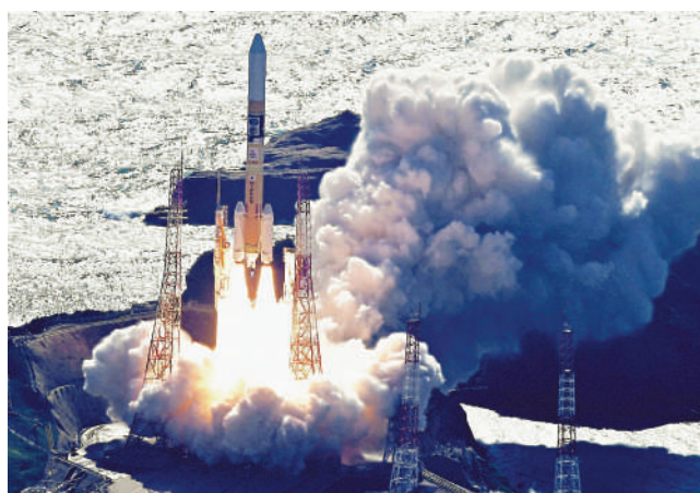
▲9月，搭載SLIM登月器的H-2A火箭在日本種子島航天中心發射升空。

日本近年積極參與登月計劃。日媒報道稱，日本將派出至少2名太空人參與由美國主導、目標在2025年後載人登月的「阿耳忒彌斯」計劃，最快將於下月與NASA簽署協議；此外，JAXA還將與豐田合作開發可以載人在月球表面低重力環境下使用的探月車「Lunar Cruiser」，預計將於2030年交車。