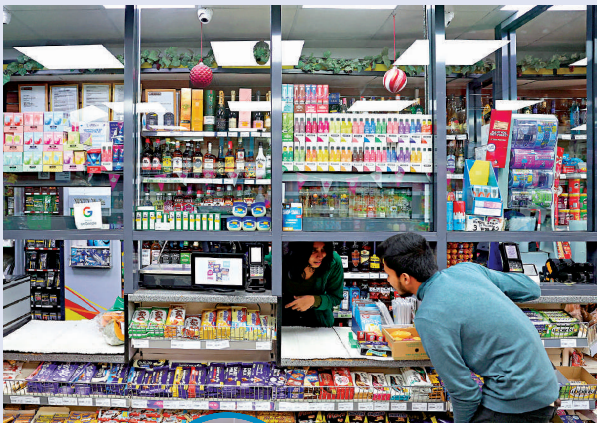
▲英國倫敦南部一家食品商店在收銀台上安裝了安全玻璃，防止商店被盜。