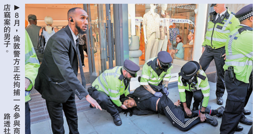
8月，倫敦警方正在拘捕一名參與商店竊案的男子。

【大公報訊】綜合《衛報》、《快報》、《每日郵報》報道：英國商店近年來竊案猖獗，每年至少對零售業造成10億英鎊（約99億港元）的損失。然而警方卻往往對這些「輕罪」置之不理，去年至今有超過20萬宗商店行竊案件仍未偵破，當局甚至還計劃在英格蘭和威爾士地區，不再對盜竊案犯人判處12個月以下的短期徒刑，英媒評論指出，此舉或將變相助長小偷小摸行為。