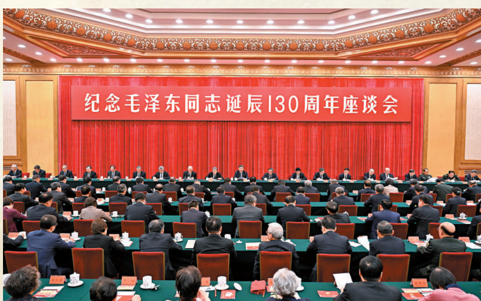
▲26日，中共中央在北京人民大會堂舉行紀念毛澤東同志誕辰130周年座談會。座談會前，習近平、李強、趙樂際、王滬寧、蔡奇、丁薛祥、李希、韓正等領導同志來到毛主席紀念堂瞻仰毛澤東同志遺容。 新華社