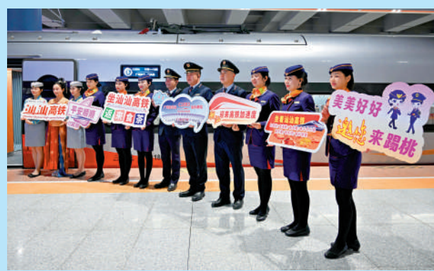
▲在當日正式運營的廣州白雲站內，首發列車C1893次列車乘務組合合影。