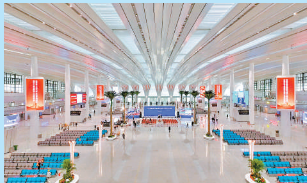
▲廣州白雲站為「方一圓一方」布局，走進候車大廳，屋頂璀璨的燈帶設計映入眼簾。