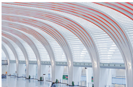
▲白雲站內明亮大氣，處處體現木棉元素。