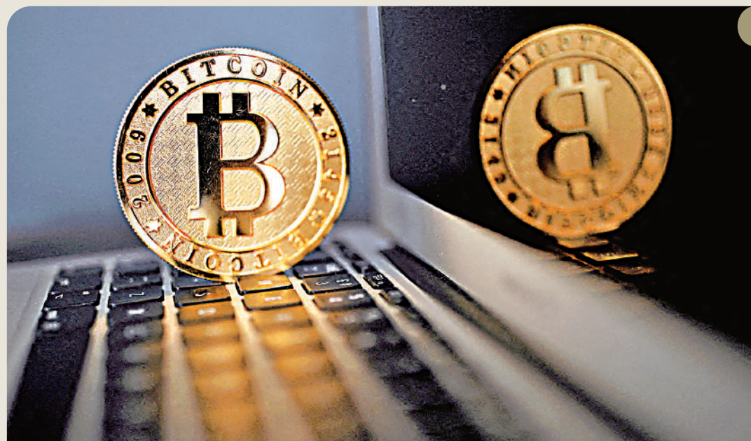
▲加密貨幣「一哥」比特幣今年大幅反彈1.5倍。

至於油價，紐約期油每桶報71.65美元，倫敦布蘭特期油報77.04美元，全年齊跌逾一成。展望明年油價，考慮到全球經濟放緩，高盛預計布蘭特期油均價為80至81美元，國際能源署料布蘭特期油均價為82.57美元。