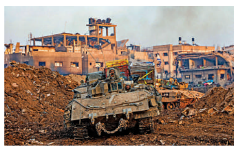
▲ 2023年12月19日，以軍在加沙北部開展軍事行動。

9 2023年10月7日，巴勒斯坦伊斯蘭抵抗運動（哈馬斯）對以色列發動突襲，發射數千枚火箭彈，並派遣武裝人員進入以國境內挾持人質，以色列方面有約1200人喪生。以總理隨即宣布以色列進入「戰爭狀態」，對加沙發動空襲及地面進攻。本輪衝突持續近三個月，僅有短短7天臨時停火，成為20年來死傷最嚴重的一輪巴以衝突。加沙地帶正遭遇「前所未有」的人道主義災難，有超過2萬人死於戰火，其中七成為婦孺，停火止戰成為國際社會的主流呼聲。