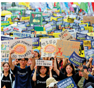
▲ 韓國民眾抗議日本排放核污水。

8 2023年8月24日，日本政府無視國際社會強烈質疑和反對，單方面強行啟動福島核事故污染水排海，預計整個排海計劃為期至少30年，排放核污水總量將超過100萬噸，引發日本國內外持續強烈反對。德國海洋研究機構研究表明，自排海之日起，57天內相關放射性物質即可擴散至太平洋大半區域，10年後蔓延至全球海域。中國內地全面停止進口日本水產品，香港和澳門亦對日本海產加強了進口限制；多方決定加強對日本水產品的輻射監測。