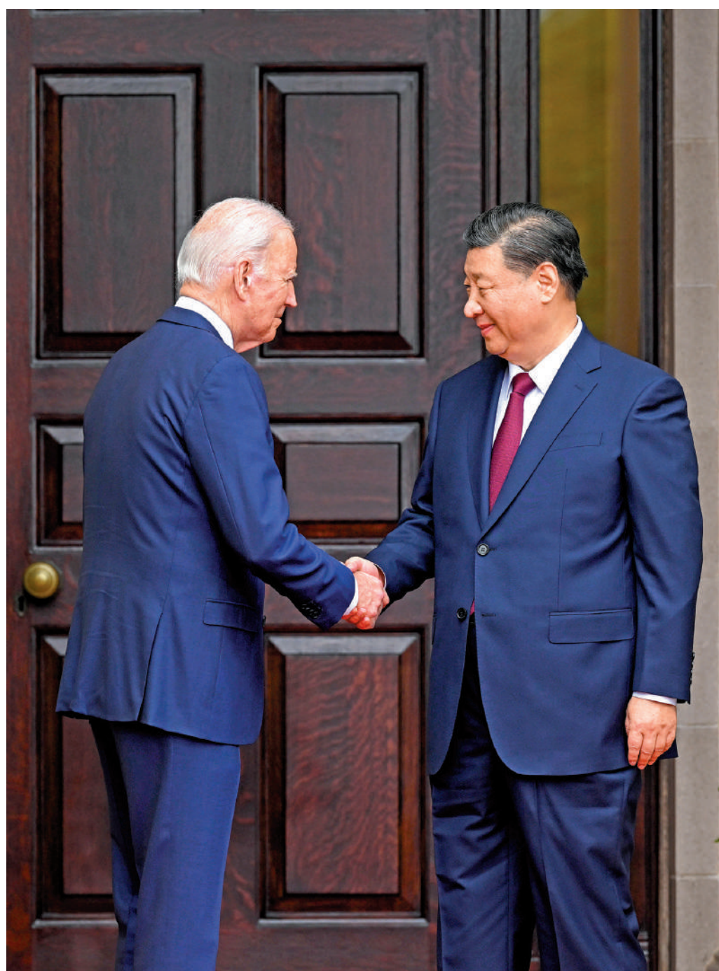
▶ 2023年11月15日，中國國家主席習近平同美國總統拜登在斐洛里莊園舉行中美元首會晤。

2023年11月15日，中國國家主席習近平在美國斐洛里莊園同美國總統拜登舉行中美元首會晤，兩國元首就事關中美關係的戰略性、全局性、方向性問題以及事關世界和平和發展的重大問題坦誠深入地交換了意見。 習近平指出，這次舊金山會晤，中美應該有新的願景，共同努力澆築中美關係的五根支