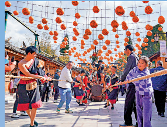
▲1月1日，在雲南昆明，遊客與佤族姑娘小伙一起拉木鼓，感受節日氣氛。