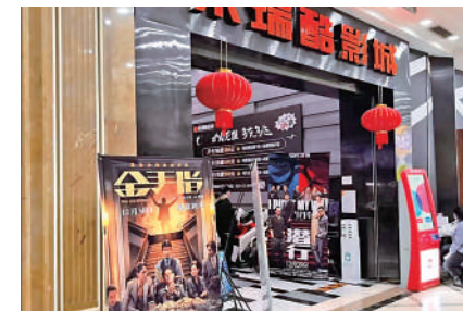
▲北京某電影院入口處播放《金手指》、《潛行》宣傳海報。