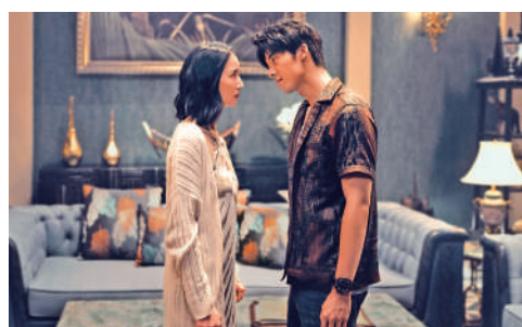
▶許光漢（右）與張鈞甯合演電影《瞞天過海》。