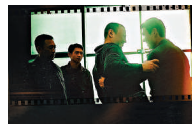
▲漫漫緝兇路上，三大隊成員因不同理由離開。