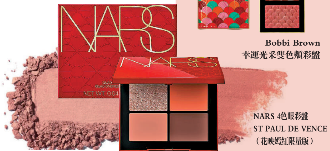
NARS 4色眼影盤 ST PAUL DE VENCE (花映嫣紅限量版)