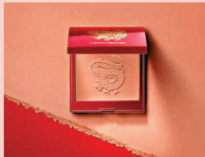
LAURA MERCIER 輕肌漂染頰彩盤