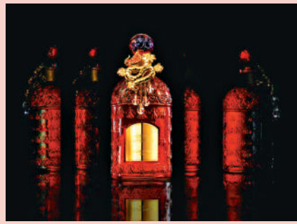
嬌蘭藝術沙龍迷夜橙花淡香精 幸運掌紅璀璨蜂印瓶