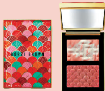
Bobbi Brown 幸運光采雙色頰彩盤