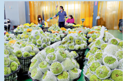
▲台灣農產品進口大陸若失去關稅優惠，將降低競爭力。圖為台灣農民採收的釋迦。資料圖片

【大公報訊】記者蘇榕蓉報道：對於大陸方面研究進一步中止ECFA關稅減讓，台灣南部屏東縣劉姓漁會負責人向大公報表示，如果ECFA中止關稅減讓，台灣地區將會在兩岸貿易中失去逾千億美元的貿易順差，失去在大陸市場的優待待遇，台灣地區的製造業和農漁業將