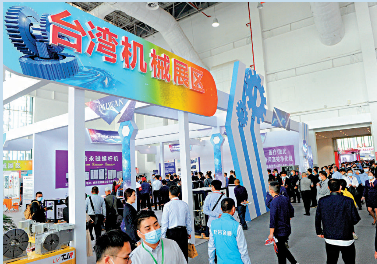
▲大陸方面研究進一步採取中止ECFA早期收穫農漁、機械、汽車零配件、紡織等產品關稅減讓等措施。圖為台灣機械業者到大陸參展。