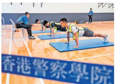
警隊調整入職條件後，投考警員數字大幅飆升。

海外方面，警隊於2018年將「警隊學長計劃」擴展至包括就讀於海外大學的香港學生，共錄得281名海外學生加入該計劃，當中更有40人已加入警隊，此外，警隊過去12個月共聘請了93名畢業於海外院校的人士。