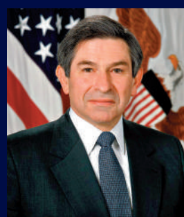
▲美國前國防部副部長Paul Wolfowitz曾收取黎智英的資金。