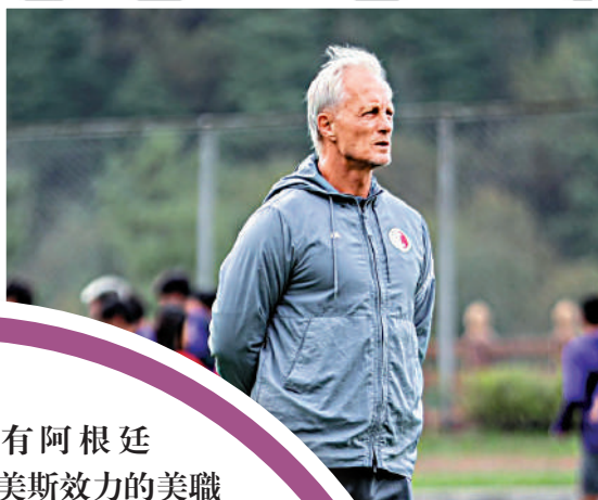
▲安達臣正帶領中國香港足球代表隊征戰亞洲盃決賽周。