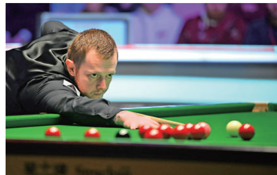
▲北愛爾蘭的艾倫是桌球大師賽8強中唯一非英格蘭球手。