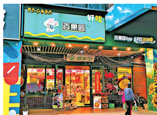
▲百果園禁售期解禁，股價大瀉三成，跌至上市以來最低位。