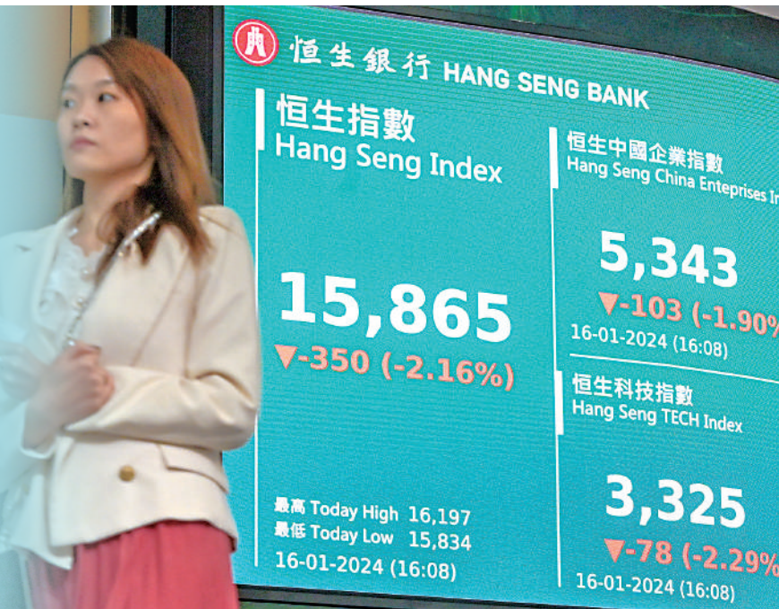
▲港股昨日回吐超過300點，失守16000點，見2022年11月低位。