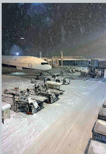
▲北海道16日大雪，新千歲機場取消數十個航班。