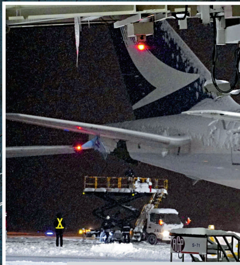
▲北海道新千歲機場16日發生事故，涉事飛機機身損壞。