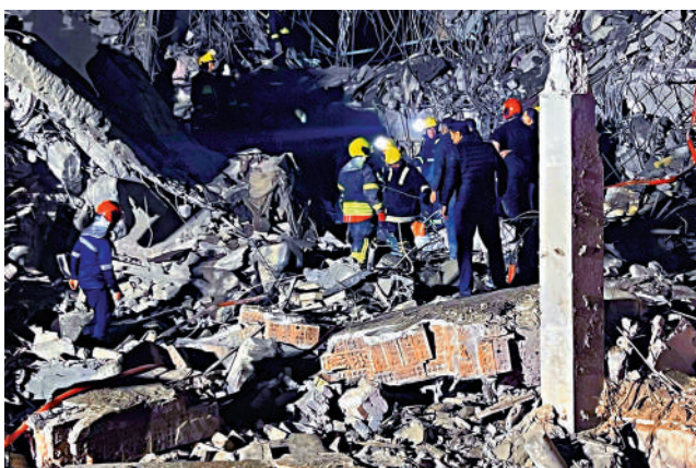
▲消防員和安保人員16日在伊拉克埃爾比勒被空襲的一處建築廢墟內檢查。

伊朗伊斯蘭革命衛隊16日表示，以色列摩薩德組織位於伊拉克庫爾德斯坦首府埃爾比勒的總部是此次襲擊的目標之一，「為了回應猶太復國主義政權最新的邪惡行為」。襲擊發生後，美國駐埃爾比勒領事館附近發生多起爆炸，至少4人死亡，另有6人受傷，死傷