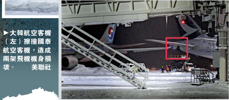
▲大韓航空客機（左）擦撞國泰航空客機，造成兩架飛機機身損壞。