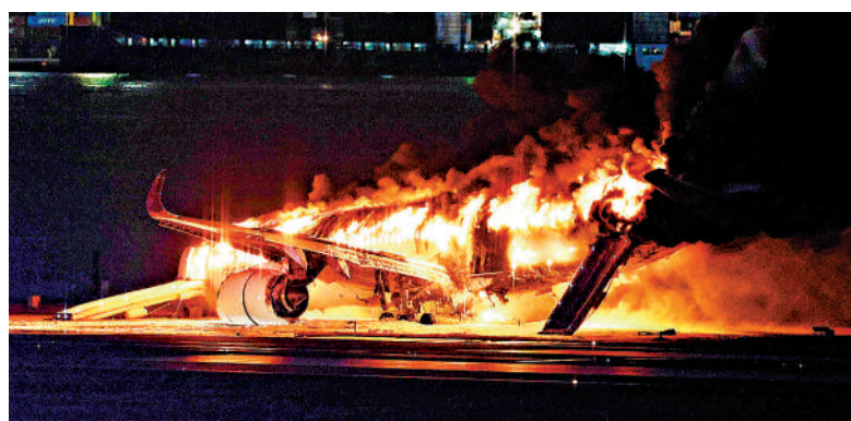
▲一架日本航空公司的飛機2日東京羽田機場的跑道上撞機後起火。