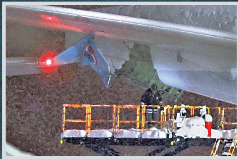
▲16日在北海道新千歲機場，工作人員檢查涉事客機狀況。

【大公報訊】綜合NHK、路透社及法新社報道：日本羽田機場1月2日發生嚴重撞機事故，外界心有餘悸之際，北海道新千歲機場又發生客機擦撞事故。當地時間16日下午，在北海道新千歲機場，一架韓國大韓航空客機擦撞一架香港國泰航空客機，造成機身不同程度受損，所幸事故沒有造成人員傷亡。羽田撞機事故發生後，日本當局發布一系列的整改措施，但近期又有事故，令外界對日本機場安全的信心再度降低。