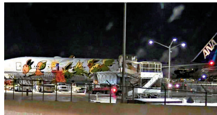
▲全日空的一架波音飛機於14日在美國芝加哥機場與達美飛機擦撞。