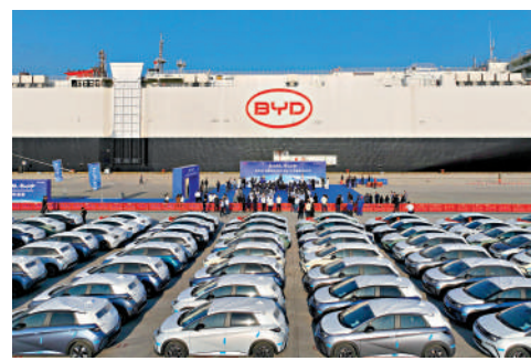
▲15日，搭載五千多台新能源車的比亞迪「開拓者1號」將從深圳港小漠國際物流港出發駛往歐洲。

展，海關加強與港澳國際貿易「單一窗口」合作，上線粵澳集報貨物「一單兩報」、粵港公路倉庫「一單兩報」等新功能，大幅壓縮企業申報項目50%以上。