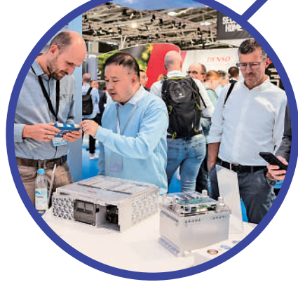
▲去年慕尼黑國際商展，中國展商數量翻番。

致辭後，李強就人工智能全球治理、多邊體系等問題回答了施瓦布的提問，強調要堅持以人為本、普惠包容，以「善治」促「善智」，引導人工智能朝着有利於人類文明進步的方向發展；真正的多邊主義，應基於以聯合國憲章宗旨和原則為基礎的國際關係基本準則，中國自己不搞「毀約退群」，也不要求其他國家「選邊站隊」，始終是維護多邊主義的堅定力量。