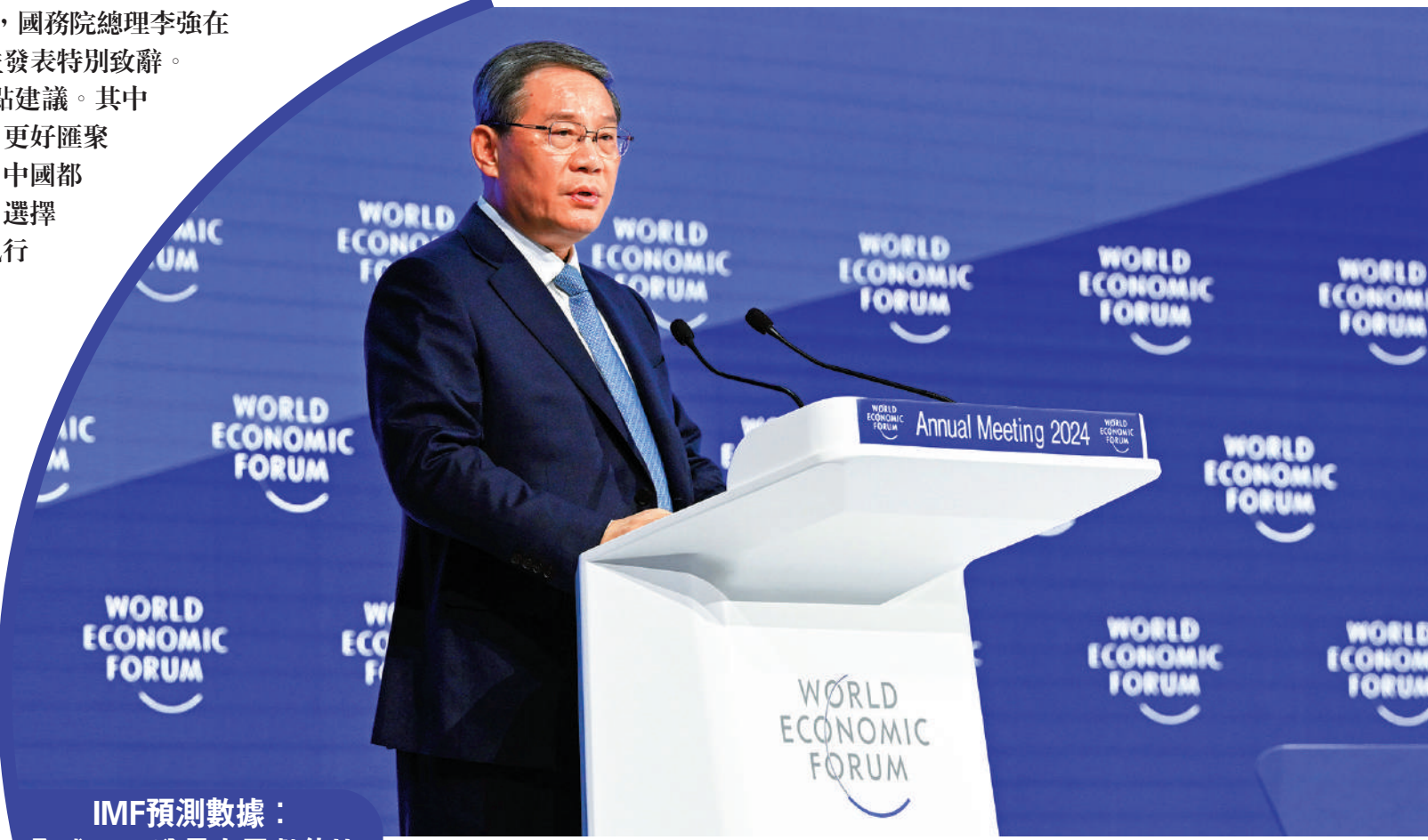
▲當地時間1月16日上午，國務院總理李強在瑞士達沃斯國際會議中心出席世界經濟論壇2024年年會並發表特別致辭。新華社