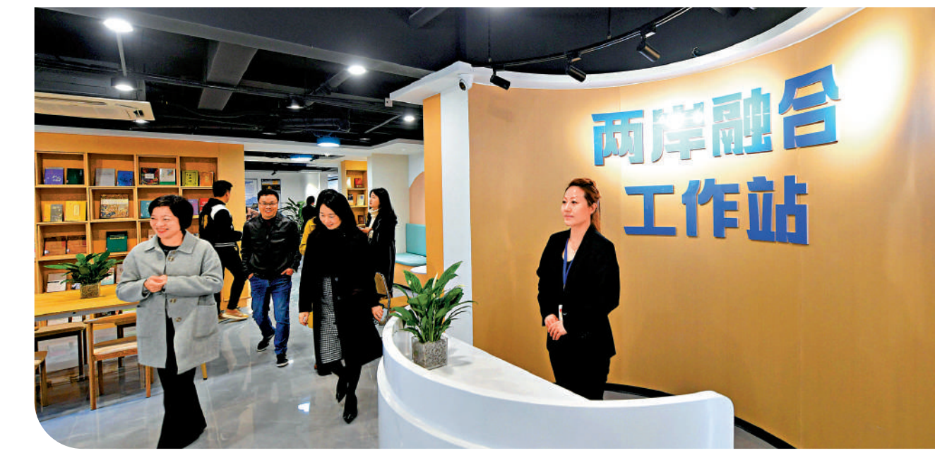
▲大陸方面積極推動兩岸融合發展。圖為福州市建立兩岸融合交流中心，設有兩岸融合工作站、台胞接待區、圖書閱讀區、人才服務工作室、多功能會客室等。

這段分析雖然對國民黨極盡揶揄之詞，但也一針見血地指出如果民進黨支持者「鐵板一塊」無法撼動，如果國民黨無法推出吸引選民的候選人，如果國民黨和民眾黨不能成功整合，民進黨下次再贏得執政權不無可能。然而，台島政治局勢波譎雲詭、千變萬化，而且「選民心，海底針」，誰又能摸得透呢？要贏得一場選舉，有很多因素，其中很重要的一個因素就是團結。而這正是台灣地區泛綠陣營的最大優勢，卻是