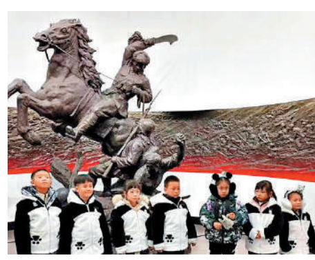
▲台灣「小當歸」在哈爾濱與小朋友們合照。

的孩子，一定會被無限寵愛和熱情款待。「我們熱忱歡迎台灣的小朋友、小朋友們，多來大陸旅遊觀光，飽覽大好河山，且看神州新貌。」