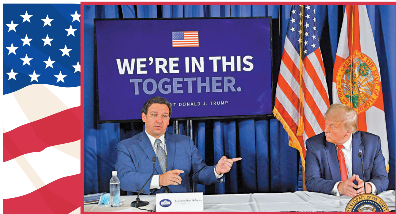
▲德桑蒂斯（左）21日宣布退選並表態支持特朗普（右）。圖為兩人於2020年7月一同出席會議。

艾奧瓦州初選告捷令特朗普鞏固了在黨內選戰中的優勢地位。若果特朗普在新罕布爾州「再下一城」，他在共和黨內的廣泛吸引力將得到有力印證。美國競選活動顧問亞歷克斯·科南特分析說，如果特朗普實現開局兩連勝，很難想像其他人還能後來居上；但如果他輸了，共和黨選戰的敘事和態勢可能發生改變。