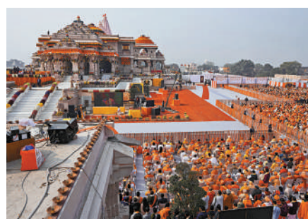
▲印度22日舉行羅摩神廟神像開光儀式，大批信徒到場慶祝。