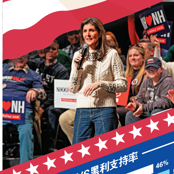
▲黑利21日在新罕布爾州造勢。