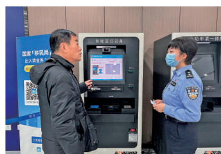
▲1月11日，公安局出入境工作人員引導市民使用智能簽注機。