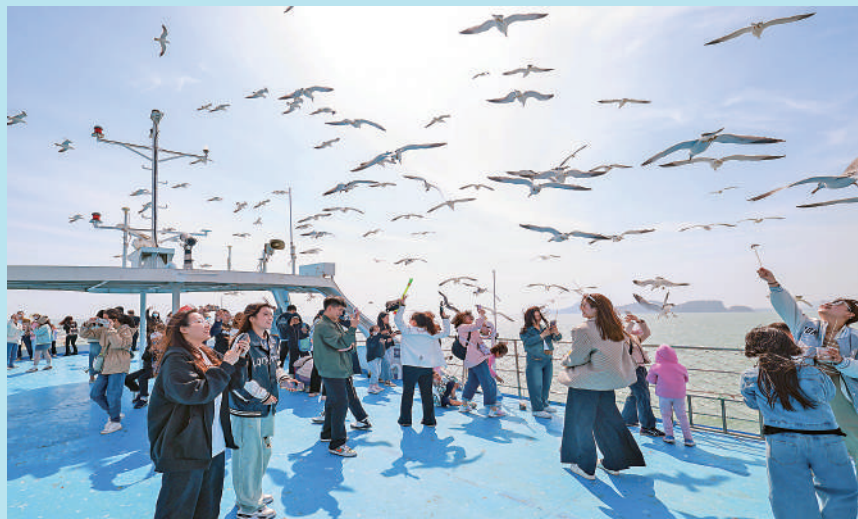
▲遊客在郵輪上餵食黑尾鷗。