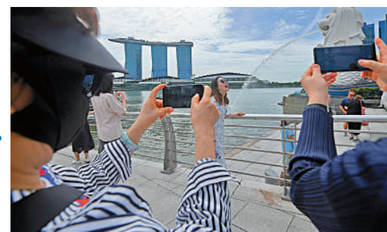
▲中國遊客在新加坡魚尾獅公園拍照留影。