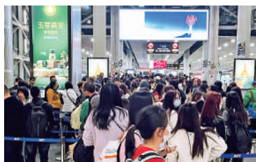
2023年12月23日，中國遊客在泰國機場排隊準備入境。