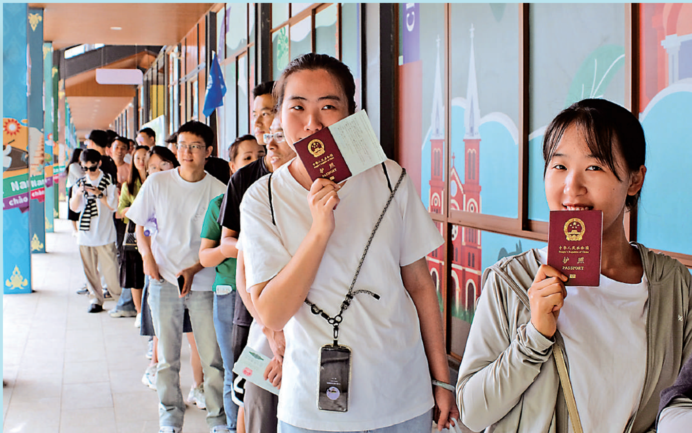
▲廣西崇左市邊境，遊客手持護照等候辦理落地簽證入境越南。