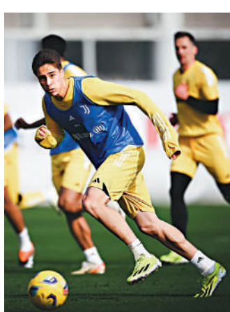
▲祖雲達斯球員備戰對烏甸尼斯的賽事。