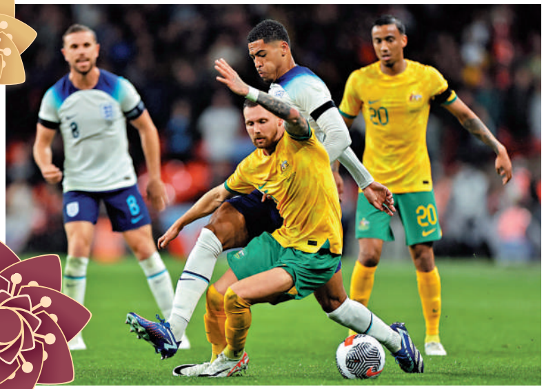
▲高維爾（右二）代表英格蘭隊在對澳洲的友賽上陣。