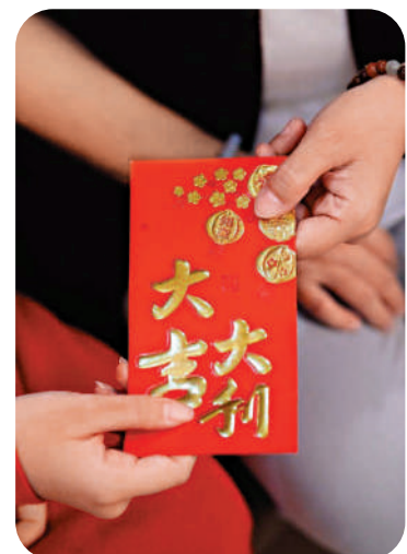
▲新年派利是，寓意大吉大利。

我相信這種利是封售價不高，只是銀行送給客戶的利是封設計吸引，印刷精美，最重要的是免費。銀行派發利是封的日子，人龍延伸到門外。祖母和母親當然不會錯過機會，不過取得的數量太少，還是要買。母親持家節儉，重用收來的利是，省下買利是封的金錢。母親長年研究