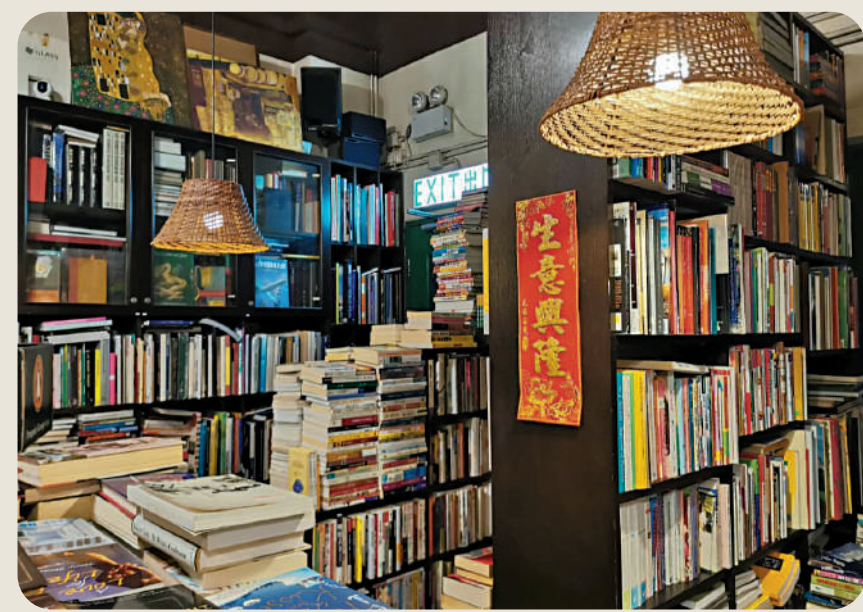
▲香港擁有不少別具特色的二手書店。

然而，此番又見這本書，我清晰地意識到，我們的身體髮膚正在一刻刻磨損，時至今日，我只會可惜，那些猶豫不決的時刻不敢太貪心，不夠勇氣飛天遁地，和對方一起暢遊記憶的海。斤斤計較於付出的時間與精力，對自己在情感上的收支平衡狀態要求過於苛刻，徒留許多與時間相關的遺憾。也是在這個對過往時間進行召喚的空間，我最終明白，其實最關鍵的並不是二手書店本身，而是那些和人一起的記憶。逛過世上最好的書店，也不比有一日與某人於某地偶然發現一本舊書，居然還是民國時期的初版，我們因此會心一笑的快樂。天知道，正是這些時刻，讓我重新遇見我的赤子心。