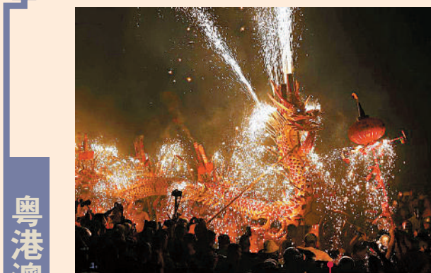
高林煙花火龍：揭陽地區一項獨特的民俗活動，正月初一開始游龍、舞龍活動，正月初十晚燃放煙花火龍是活動高潮。