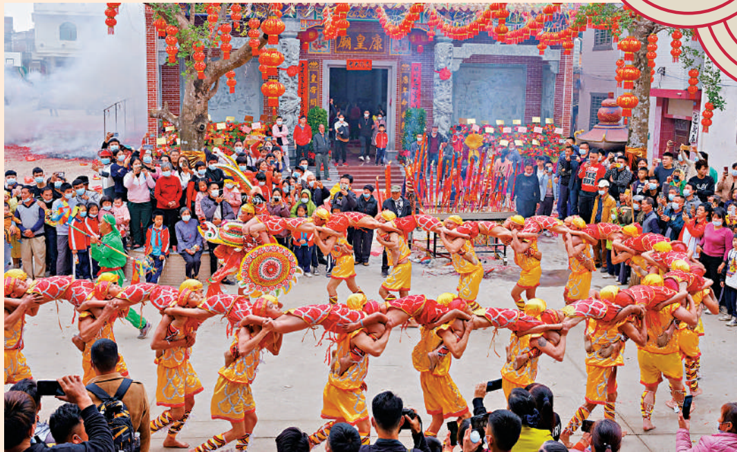
在湛江東海島東山圩，每次村裏表演人龍舞，都會吸引大批村民和遊客前來觀賞。