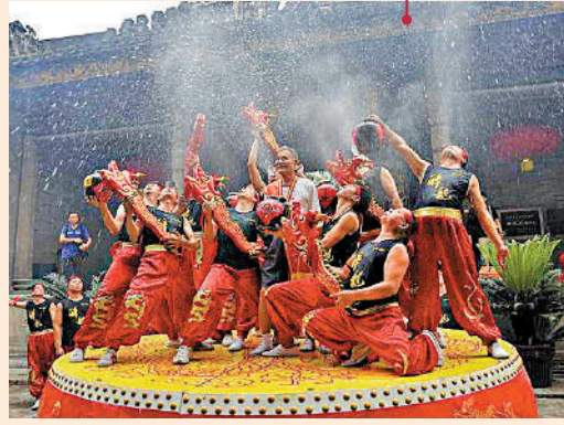
汕尾滾地金龍：汕尾市傳統舞蹈，始創於北宋末年。表演時一人舞龍頭，一人舞龍尾，並按規範的舞步程式作滾地表演。