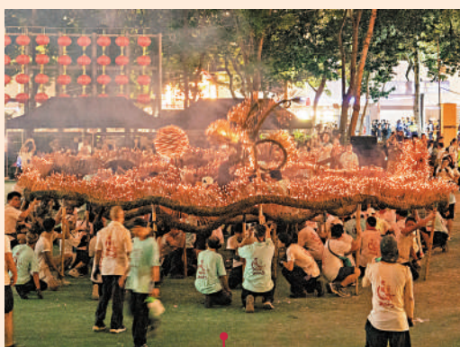
埔寨火龍：梅州市豐順縣埔寨鎮村民鬧元宵的傳統民間舞蹈，有火龍隊、喜炮隊、龍燈隊、鼓樂隊共100多人參加。