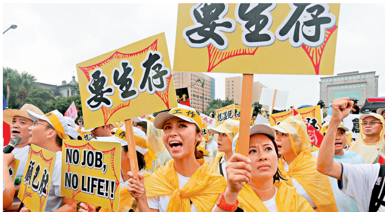
▲民進黨上台後破壞兩岸關係，阻礙兩岸人員往來，重創台灣旅遊界生意。圖為台旅遊界人士集會抗議民進黨當局漠視民生。資料圖片

赴大陸旅行團業務被喊停的消息傳出，島內媒體報道被網友「加持」點評：「打自己小孩出氣自殘。」「耍狠？只整到台灣旅遊業者。」「是誰不跟大陸溝通？」「只為抗中，不顧百姓，為所欲為，『死』的是百姓，高官坐領高薪，何懼之有！」