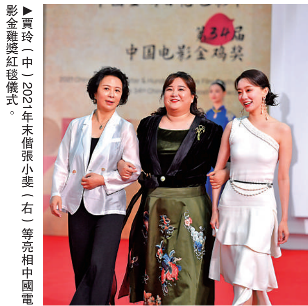
▲賈玲（中）2021年末借張小斐（右）等亮相中國電影金雞獎紅毯儀式。