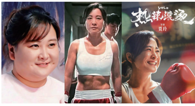
▲賈玲為電影可以去到幾盡？由肥變瘦都難不到她。